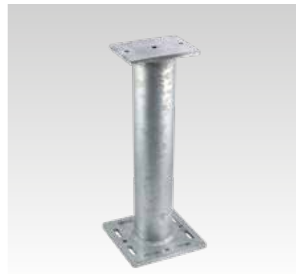
MPT 240x240 + 200x140, D 114,3