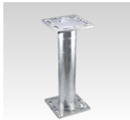
MPT 240x240 + 240x240, D 114,3