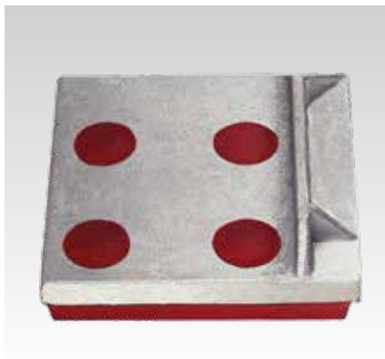
Oldal irányú ütköző