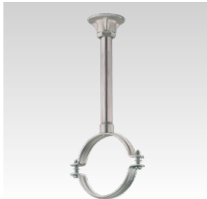
Fixpont szerelés csőmenetcsatlakozású csavaros csőbilincsel