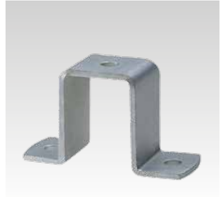
38/40, 38/48, 39/52, 40/60, 40/80, 38/80 és 40/120 profilhoz