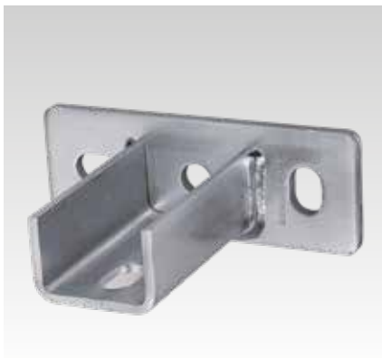
MPC-nyeregalakú rögzítő, keresztirányú