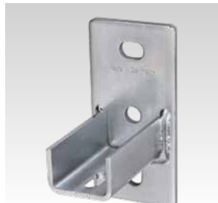
MPC-nyeregalakú rögzítő, hosszirányú