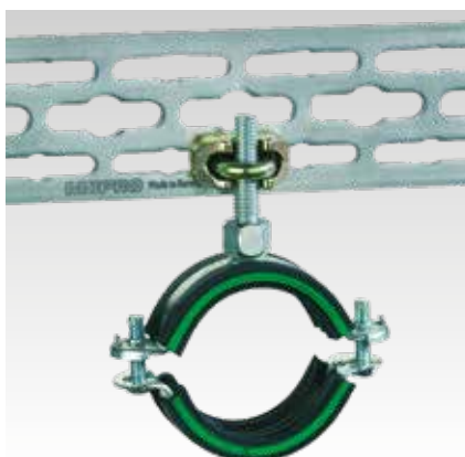
Szifonkönyök vagy keresztben futó csővezeték rögzítése - egyszerű magasságállítás