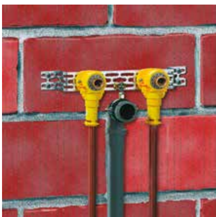
Mosdószerelés: Minden pontosan az előírt méretre szerelve