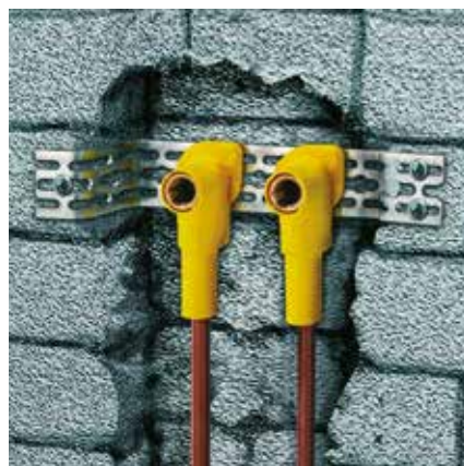
Mosdószerelés: Szerelés szűk falhoronyban