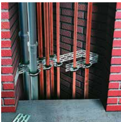
Szerelés aknában: Párhuzamosan futó csővezetéseket M8 vagy M10 menetes csap mindkét végére szerelt bilincsekkel rögzítünk a sín két oldalán