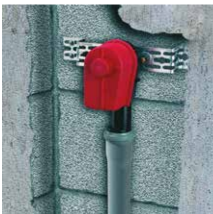
A falba építve: Mosógépszifon