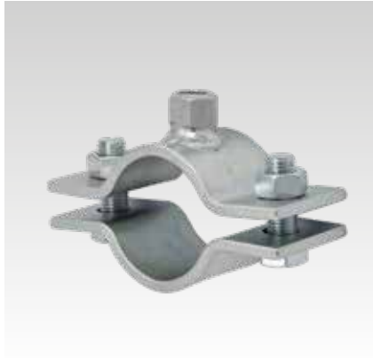
Fixpontbilincs 60 x 6