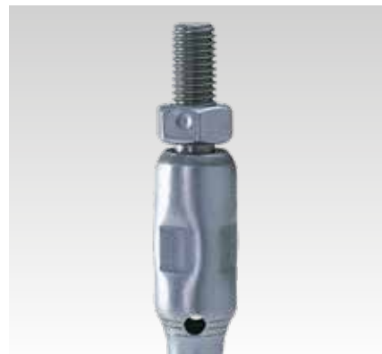
Lengő függeszték, hosszú