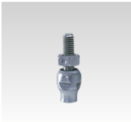
Lengő függeszték, rövid