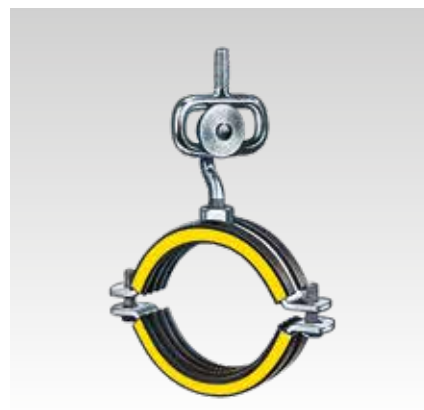
Görgős fül egy MÜPRO csavaros csőbilinccsel