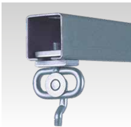
Rögzítés MPC szerelősínen