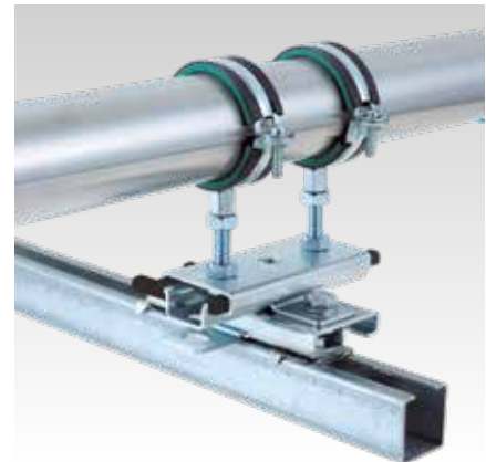
Két tolószán szerelése keresztkötésben, MPC rendszersínre állítva