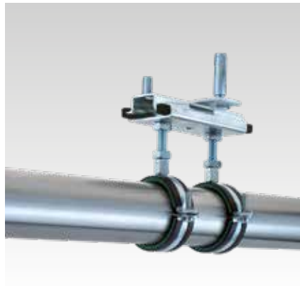
Szerelés fődémbe M8 acéldübellel