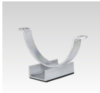
UPG-1 és az ISO-bilincs Typ 170 EX - külön rendelendő